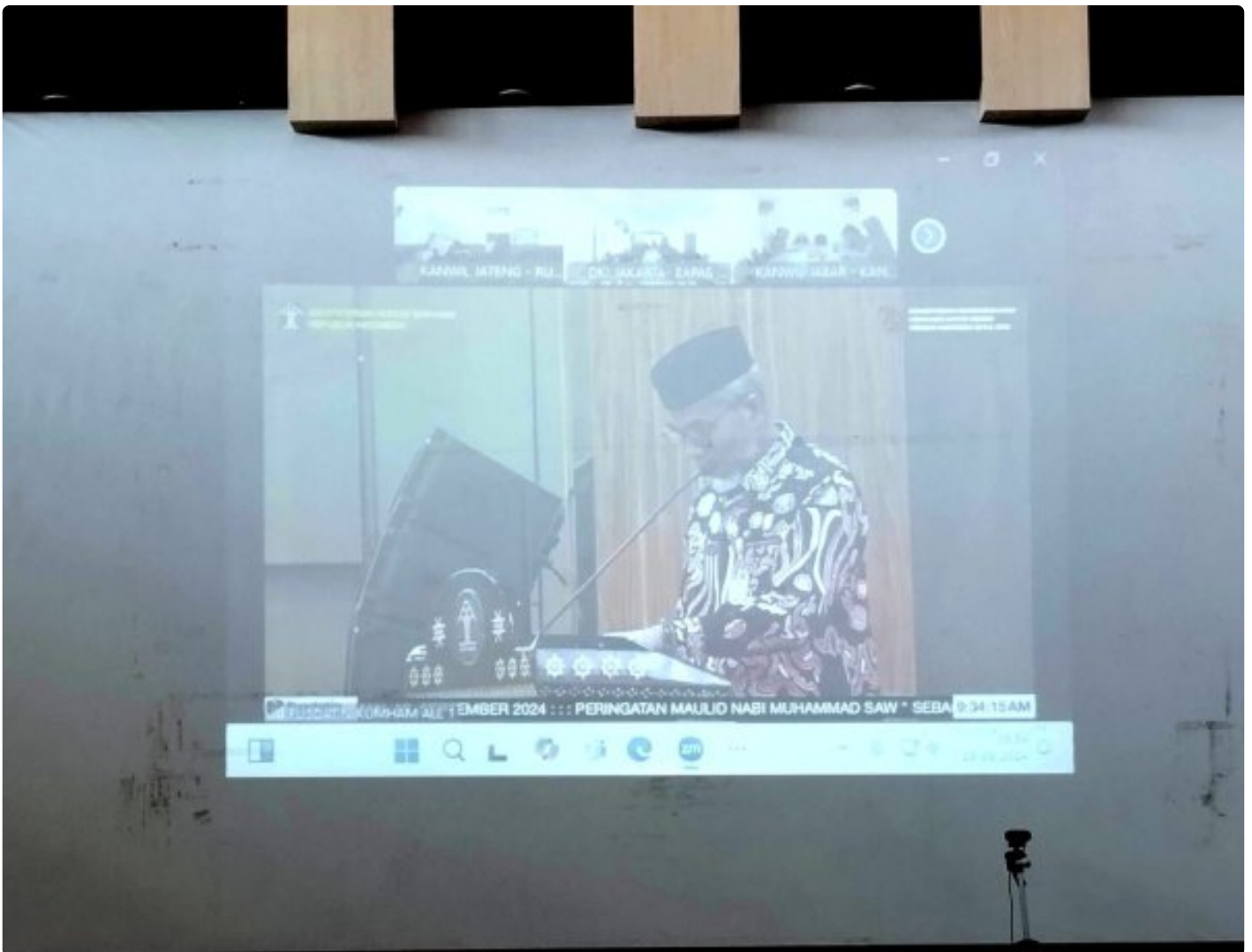
peringatan maulid bersama kemenkumham

Blora – Rumah Tahanan Negara (Rutan) Kelas IIB Blora bergabung dalam giat